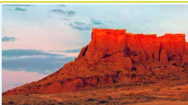
Scogliere fiammeggianti di BAYANZAG

Trasferimento nella terra dei dinosauri, nota agli occidentali come le Scogliere Fiammeggianti (Bayan Zag), famose per le loro scogliere di arenaria rossa che assumono tonalità rosse e arancioni spettacolari durante il tramonto.