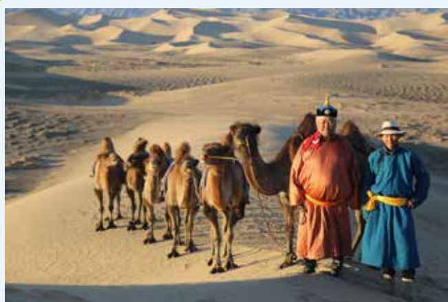
Dune di sabbia di KHONGOR

Partenza verso le dune di sabbia di Khongor, note anche come le Dune Cantanti. Le dune di Khongor sono le più grandi dune di sabbia della Mongolia, con una lunghezza straordinaria di 180 km e una larghezza di 15-20 km. C'è un'oasi vicino al fiume Khongor sul bordo settentrionale delle dune di sabbia. Potete svolgere attività a vostro piacimento, come un'ora di giro in cammello o la scalata delle dune di sabbia. Godetevi il tramonto nel deserto del Gobi, considerato uno degli spettacoli naturali più belli della Mongolia. Pernottamento presso il Ger Camp Gobi Erdene.