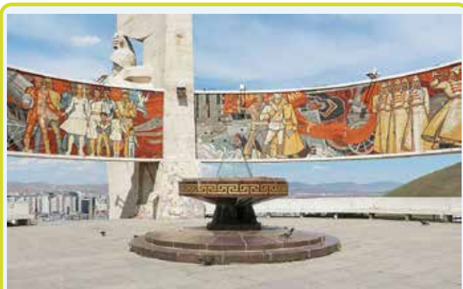
ULAN BATOR - Memoriale di Zaisan

Arrivo alle 07:15 all'aeroporto internazionale di Ulan Bator e dopo le formalità d'ingresso incontro con la nostra guida locale. Trasferimento di circa 90 minuti al nostro hotel in centro. Dopo un breve rinfresco, faremo un tour della città che inizierà dal monastero di Gandan, la piazza principale Sukhbaatar, il palazzo d'inverno di Bogd Jabzan Damba Hutagt VIII e il Memoriale di Zaisan. Cena e pernottamento in hotel.