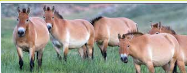
Parco Nazionale di KHUSTAI

Al mattino viaggeremo verso est per raggiungere il Parco Nazionale di Khustai, dove potremo osservare i Takhi, i cavalli selvaggi asiatici, e i cervi rossi.