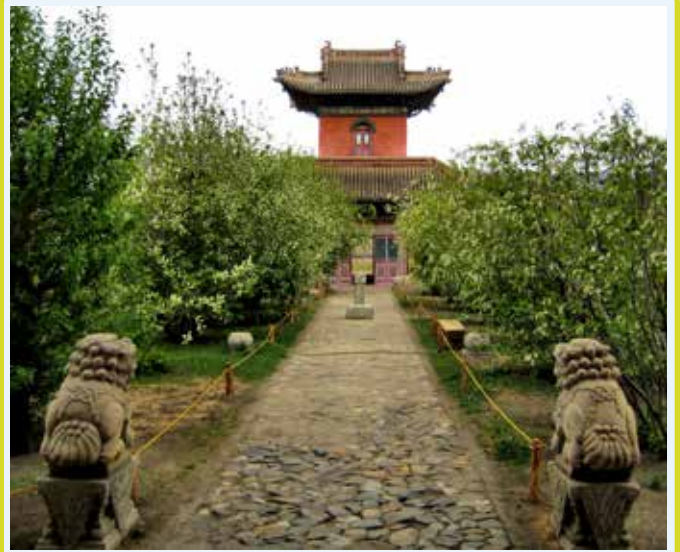
Tempio Chojjin Lama

e il 1908 in onore di un importante Lama chiamato Lubsanhadub, fratello dell'VIII Bodg Khaan. Bellissimo esempio di architettura buddista, al suo interno si trovano delle collezioni di costumi, testi sacri, sculture, dipinti, oggetti artistici e religiosi, tra cui le maschere tsam usate durante le danze sacre.